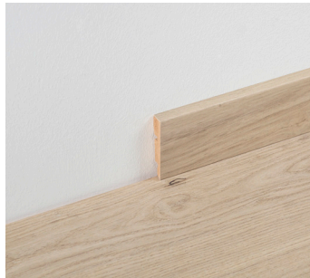
Installation mit Kleber