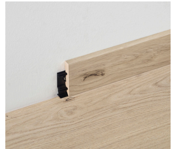
Installation mit Profilor Clips